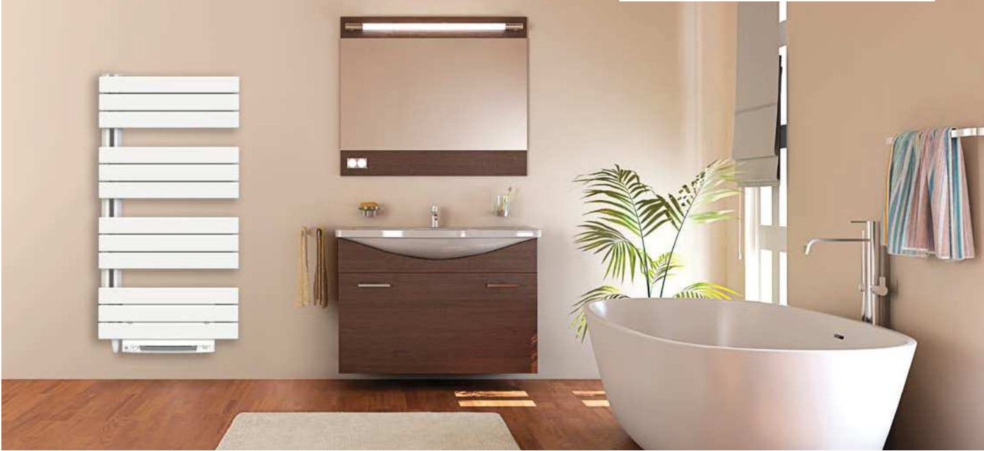
collecteur vertical à gauche